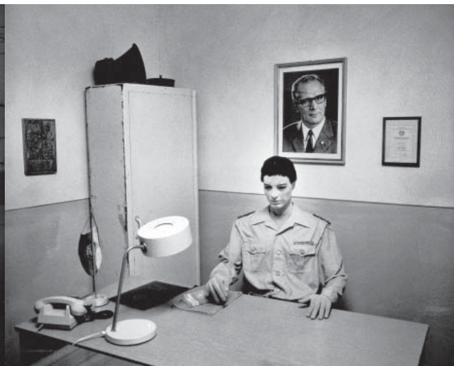
Nachbildung eines DDR-Grenzkontrollzimmers im Museum Point Alpha bei Geisa (DE), ein ehemaliger US-Beobachtungsstützpunkt an der innerdeutschen Grenze

die österreichische Diplomatie sahen Zentraleuropa als tendenziell einheitlichen Raum.