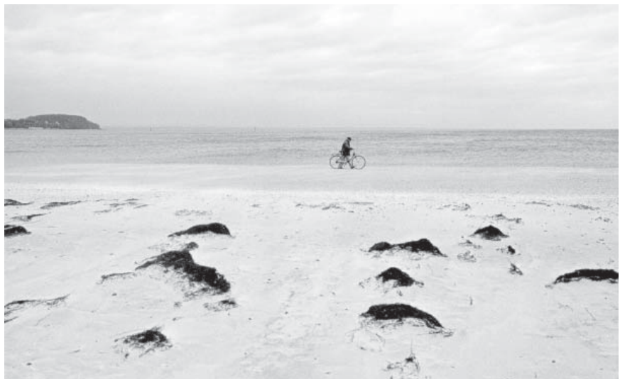
Der Radfahrer geht am Strand der Halbinsel Priwall (DE) an genau jener Stelle, an der früher der Eisernen Vorhang in die Ostsee hineinreichte. Die Halbinsel Priwall war auf der Landseite durch den Eisernen Vorhang getrennt und besaß auf der Seeseite eine Fährverbindung zu Travemünde/Lübeck.

ten Gegenstand von Konflikten, die Kroatiens EU-Beitritt behindern; zieht sich durch den Kosovo eine faktische Grenze, die auch die Stadt Mitrovica