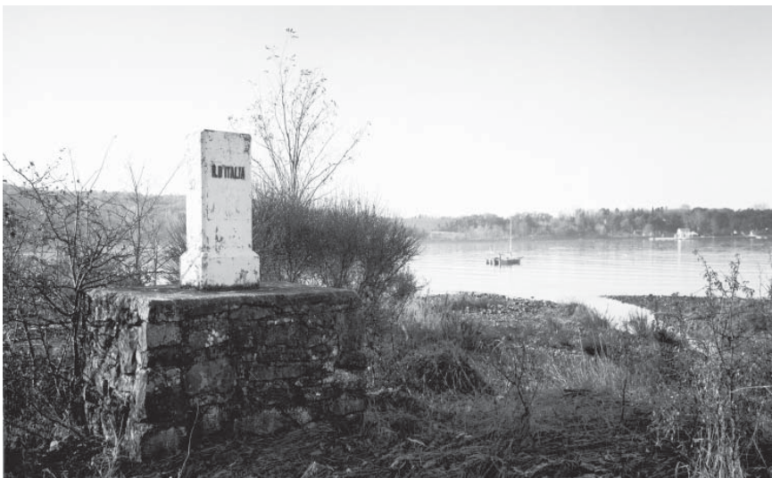
Bei diesem Grenzstein in Lazaretto (IT/SI), zwischen Muggia und Koper gelegen, befand sich eine Grenzübertrittsstelle und der ehemalige Eiserne Vorhang endete im Meer.

Zentraleuropa ist gegenüber den Versuchen der Nationalismen nicht immun. Das haben Erfolge extrem nationalistischer Parteien in allen Staaten dieses Raums bewiesen. Aber es gibt wohl keine bessere Perspektive für die zentraleuropäischen Staaten als die Chance, als Teil eines gemeinsamen Europa weiter zusammenzuwachsen. †