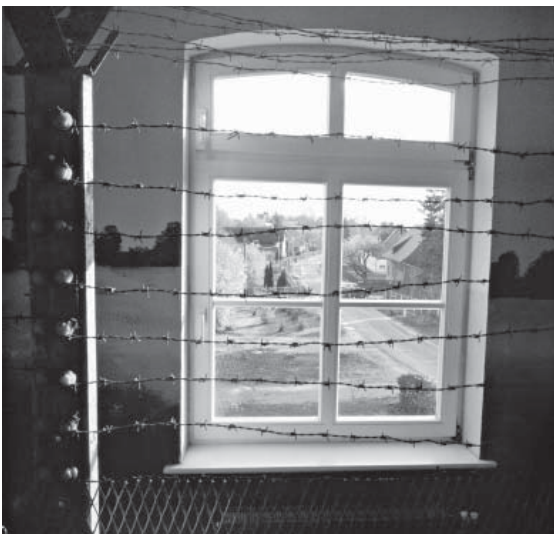
Blick aus dem Grenzlandmuseum Grenzhaus in Schlagsdorf (DE) auf die Zufahrtsstraße zu den ehemaligen Grenzsicherungsanlagen

Grenzen, sondern Grenzen zwischen Räumen sind: Auf der einen Seite ein in das Europa der Union integrierter Raum, auf der anderen Seite einzelne Staaten, deren primäres Interesse ist, das Eintrittsbillet zu diesem Raum zu erwerben. Die Außengrenze der EU und damit auch des neu definierten zentraleuropäischen Raums sind Grenzen mit einem starken Gefälle – des Wohlstandes, des Status, der